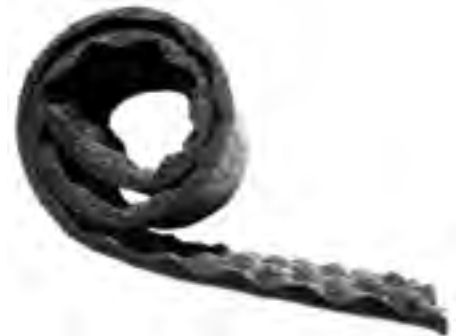
Vibro-Profi - λωρίδα